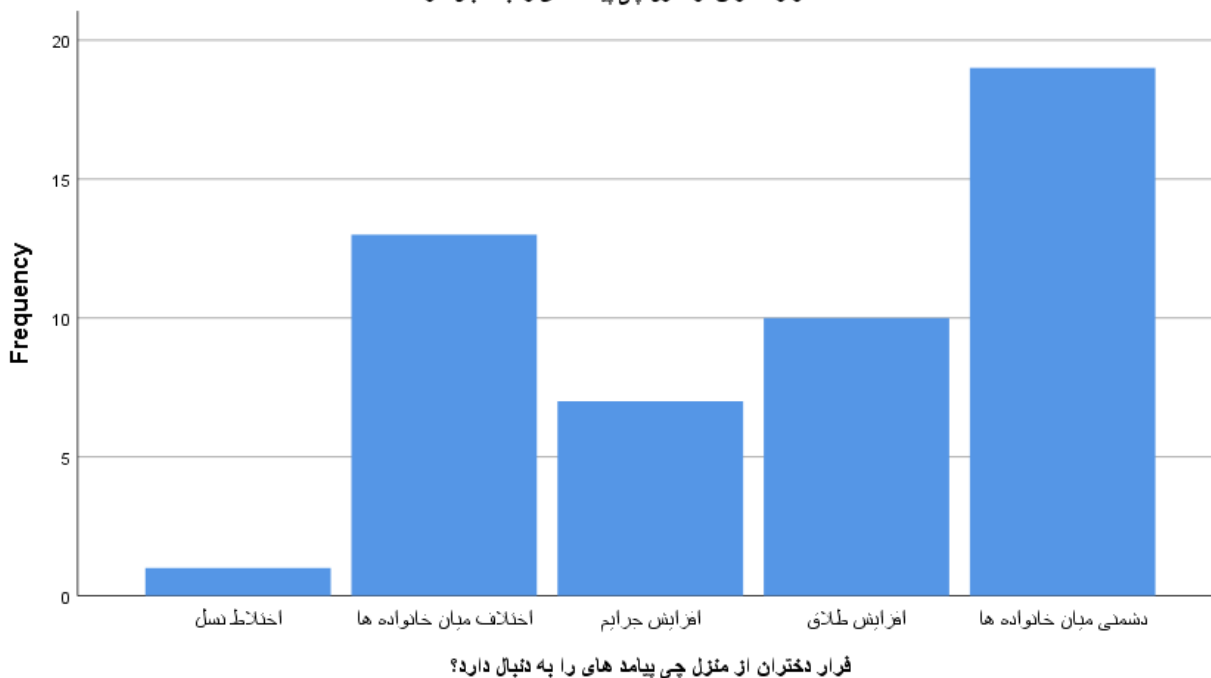
فرار دختران از منزل چی پیامد های را به دنبال دارد؟