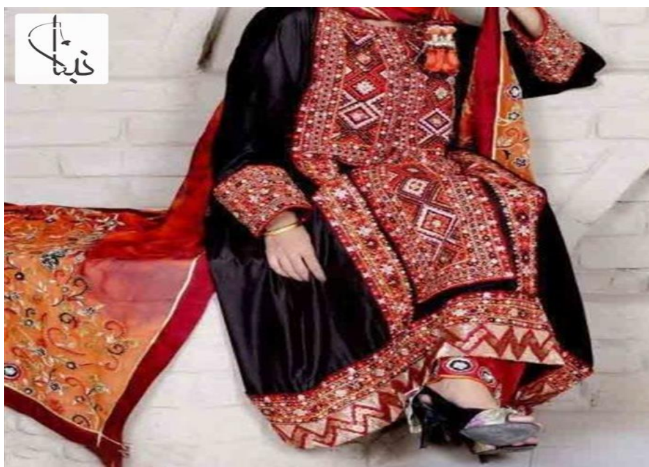
شکل طرح و رنگ لباس های سنتی بلوچی

طرح و رنگ لباس های سنتی بلوچی در مناطق مختلف استان سیستان و بلوچستان متفاوت بوده و ضمن اینکه تمامی لباس های بلوچی یک طرح اصلی دارند که دارای شلوار و پیراهنی بلند می باشند اما در طرح و رنگ و تزیینات روی آنها در حالت های متنوعی وجود خواهند داشت به طوری که در هر منطقه سعی شده تا با هنر سوزن دوزی طرح اصیلی از کشور ایران مورد استفاده قرار گیرد در واقع بزرگترین هنر دستی که بلوچی ها از خود به ثبت رسانده اند هنر سوزن دوزی میباشد امروزه این هنر در بسیاری از شهرهای ایران رواج پیدا کرده و به عنوان یک شغل از آن استفاده می نمایند. در بلوچستان زنان سالخورده و مسن سعی دارند تا برای سرپوش خود را از رنگ های تیره و البته رنگ سیاه انتخاب کرده و مورد مصرف قرار دهند اما زنان جوان بلوچی تمایل زیادی به این موضوع دارند تا برای سرپوش های خود پارچه های رنگارنگی را به کار ببندند (سیدسجادی، ۱۳۹۰، ص. ۱۵۷).