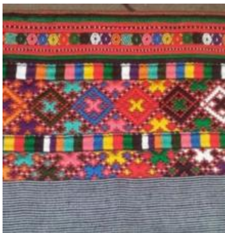
گونی (تارشمار): نوع خاصی از پارچه با تاروپود برجسته و مشخص