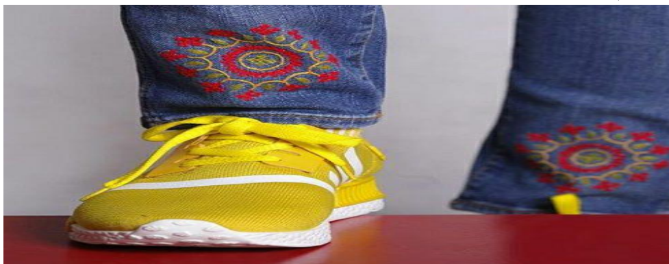
شکل طرح‌های زیبایی به کار رفته در لباس سنتی

تولیدات سوزن دوزی که قبلاً منحصر به سوزن دوزی بر روی لباس‌های محلی بود گسترش یافته و امروز با نفوذ سازمان صنایع دستی با خلق آثار و فرآورده‌های دیگری همچون سجاده، سفره، پرده، کراوات، کیف، کفش، گوشواره، دستبند، تابلو، کوسن و... از هنرمندان روبروئیم.