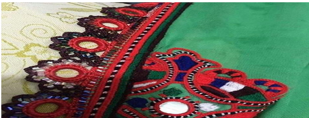
شکل هنر ترکیبی با سوزن دوزی بلوچی

آینه دوزی و آینه یکی از ابزار اصلی و اساسی ترکیبی و تکمیلی در بلوچی دوزی است که به آن زیبایی بیشتری می‌بخشد. برخی طرح‌ها با آینه دوزی به کار می‌رود مثلاً پلیواردوزی معمولاً با آینه انجام می‌شود. یکی دیگر از هنرهای ترکیبی قلاب بافی است که در بلوچی به آن کریشی گفته می‌شود. لبه پندول و همچنین لبه دامن لباس سنتی بلوچی دوزی معمولاً قلاب بافی می‌شود که به آن لعاب زیباتری ببخشید. کریشی همچنین لبه چادر و لبه شال را هم دربرمیگیرد. نخ به کار رفته می‌تواند کاموا یا نخ مخصوص قلاب بافی باشد که همیشه با رنگ‌های سوزن دوزی باید همخوانی داشته باشد.