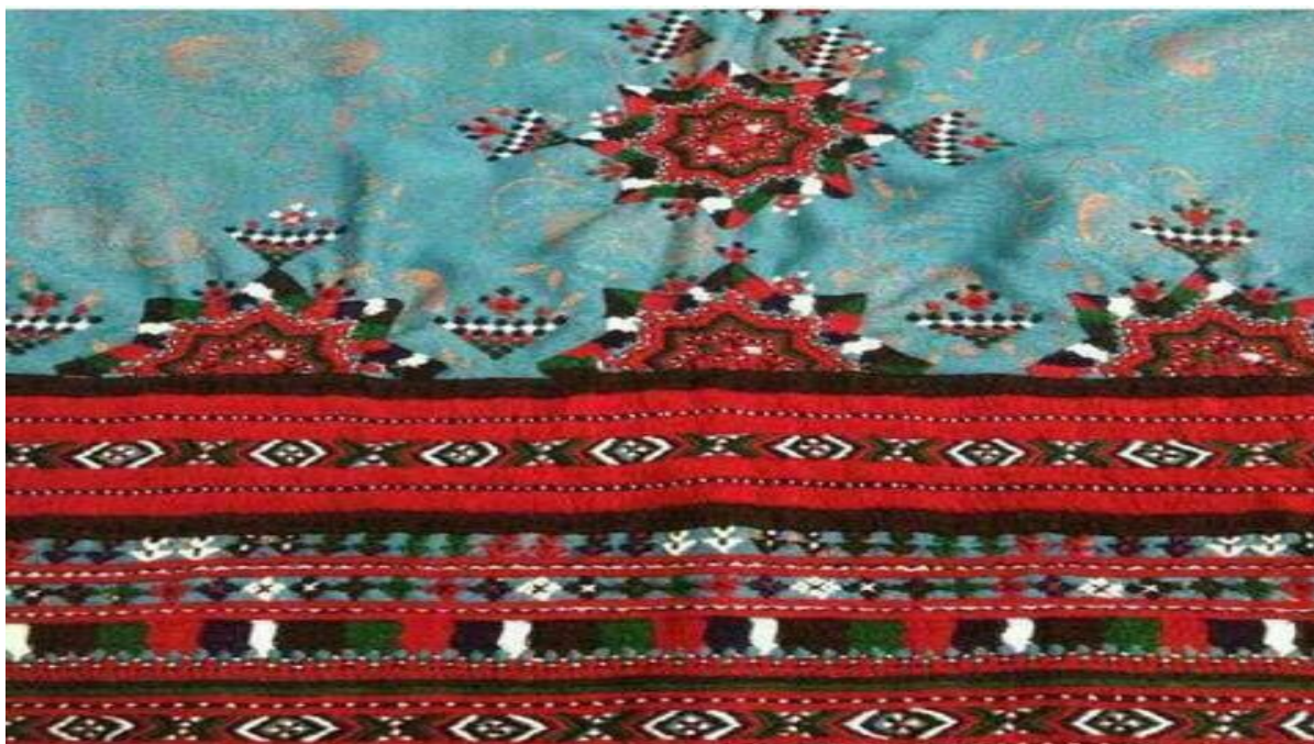
شکل نقوش زیبای به کار رفته در لباس سنتی

نقشها در روستاها و شهرهای دورافتاده از اصالت بیشتری برخوردارند بطوری که هرچه به طرف شهر پیش برویم آن اصالت کمتر به چشم می خورد. سوزن دوزی های اطراف کوههای آهوران بهترین سوزن دوزی ها هستند. نقشها را می توان همان دنیای عشق، صداقت، یکرنگی، صفا و صمیمیت زندهای بلوچ دانست که با زندگی آنها آمیخته است.