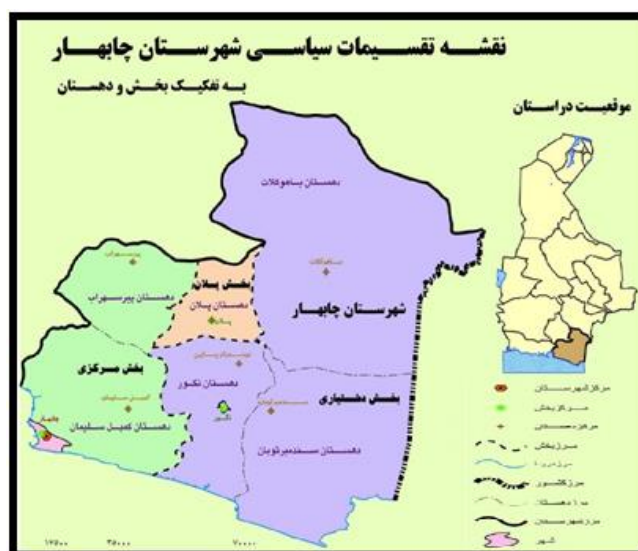
شکل (۱): موقعیت جغرافیایی منطقه مورد مطالعه

شهرستان چابهار در منتهی الیه جنوب شرقی ایران در کنار آبهای گرم عمان، در ۶۰ درجه و ۳۷ دقیقه طول شرقی و ۲۵ درجه و ۱۷ دقیقه عرض شمالی واقع شده است. از شمال به شهرستان های ایرانشهر و نیکشهر از جنوب به دریای عمان از شرق به پاکستان و از غرب به استان های کرمان و هرمزگان محدود می شود. شهرستان چابهار با وسعتی بالغ بر ۱۳۱۶۲ کیلومتر مربع حدود ۷ درصد از مساحت کل استان سیستان و بلوچستان را به خود اختصاص داده است (سلطان زاده، ۱۳۸۶: ۳). این شهرستان ۳ مرکز شهری و ۵ بخش، ۱۱ دهستان و ۵۹۲ آبادی دارای سکنه دارد. چابهار علاوه بر موقعیت بازرگانی، دارای جاذبه های فراوان تاریخی و طبیعی است. آب و هوای این شهر و پیرامون آن همیشه بهاری و معتدل است و به همین دلیل چابهار (چهار بهار) نامیده می شود.