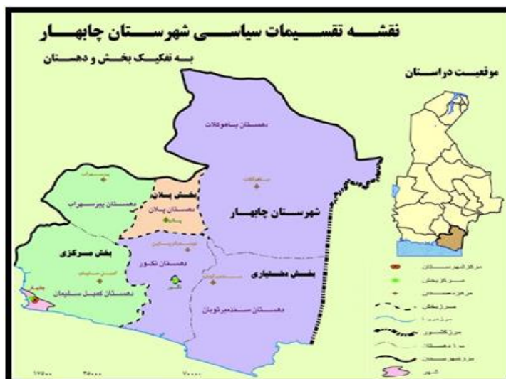
نقشه (۱): موقعیت جغرافیایی منطقه مورد مطالعه

شهرستان چابهار در منتهی الیه جنوب شرقی ایران در کنار آبهای گرم عمان، در ۶۰ درجه و ۳۷ دقیقه طول شرقی و ۲۵ درجه و ۱۷ دقیقه عرض شمالی واقع شده است. از شمال به شهرستان‌های ایرانشهر و نیکشهر از جنوب به دریای عمان از شرق به پاکستان و از غرب به استان‌های کرمان و هرمزگان محدود می‌شود. شهرستان چابهار با وسعتی بالغ بر ۱۳۱۶۲ کیلومتر مربع حدود ۷ درصد از مساحت کل استان سیستان و بلوچستان را به خود اختصاص داده است. این شهرستان ۳ مرکز شهری و ۵ بخش، ۱۱ دهستان و ۵۹۲ آبادی دارای سکنه دارد. چابهار علاوه بر موقعیت بازرگانی، دارای جاذبه‌های فراوان تاریخی و طبیعی است. آب و هوای این شهر و پیرامون آن همیشه بهاری و معتدل است و به همین دلیل چابهار (چهار بهار) نامیده می‌شود.